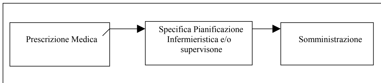
figura 2. la somministrazione dei farmaci da parte dell'infermiere